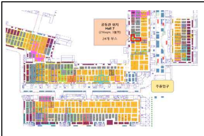
<공동관 위치(붉은색 블록)>