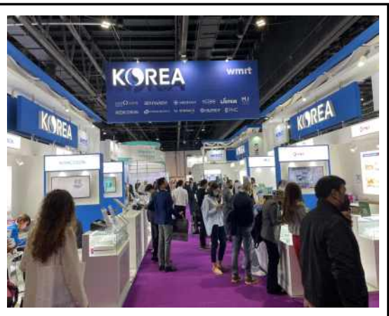
<Arab Health 2022 공동관 사진>