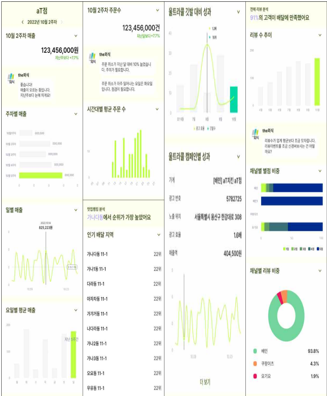
<배달앱(배달의민족, 요기요, 쿠팡이츠) 통합 데이터 분석 리포트 예시>