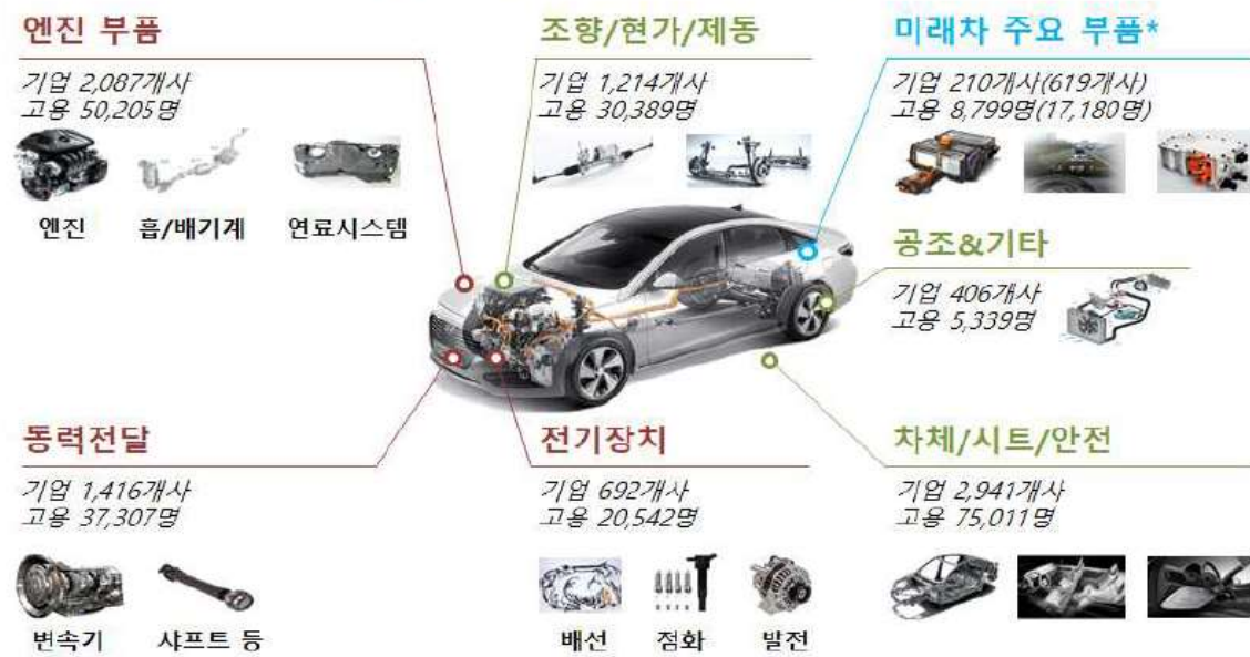
【 자동차 부품 분야별 업체수 및 고용인원 】