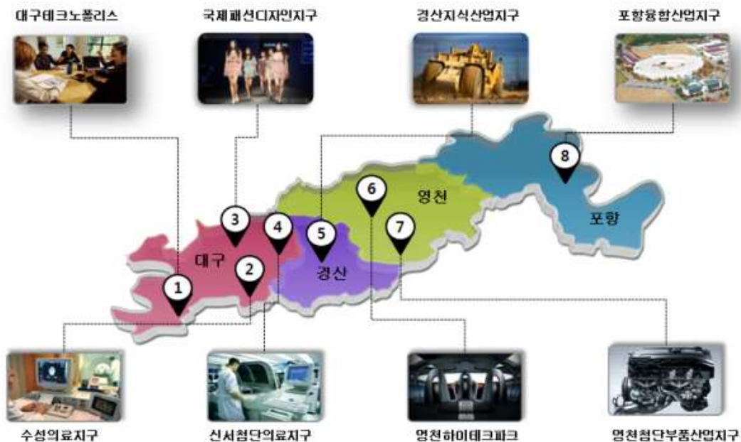
<대구·경북경제자유구역(DGFEZ) 8개 지구 위치도>