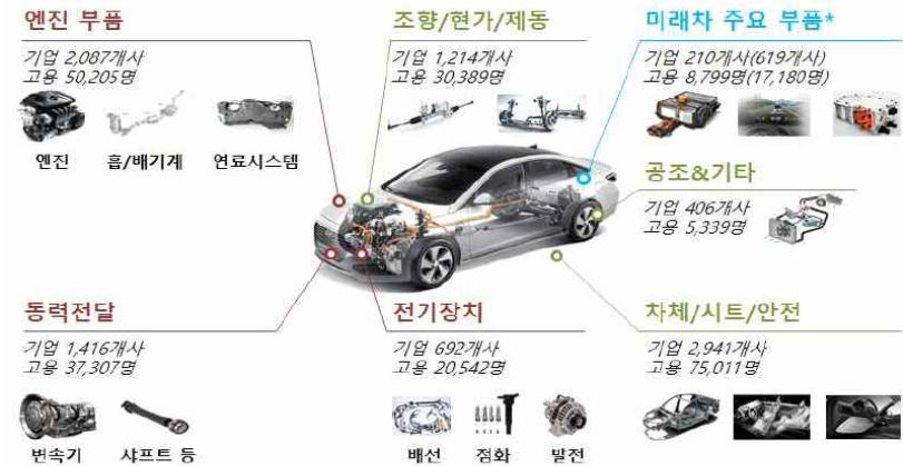
【 자동차 부품 분야별 업체수 및 고용인원 】