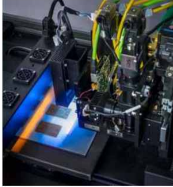
【PCB 제작용 3D 프린터】