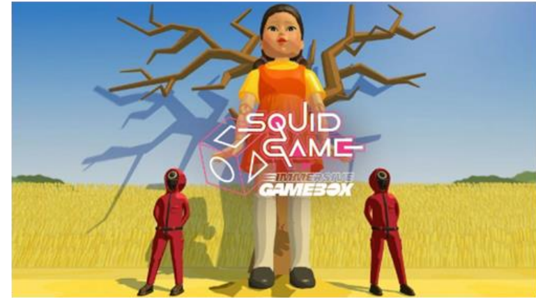
Immersive Gamebox가 출시한 Interactive game (9,41,42류)