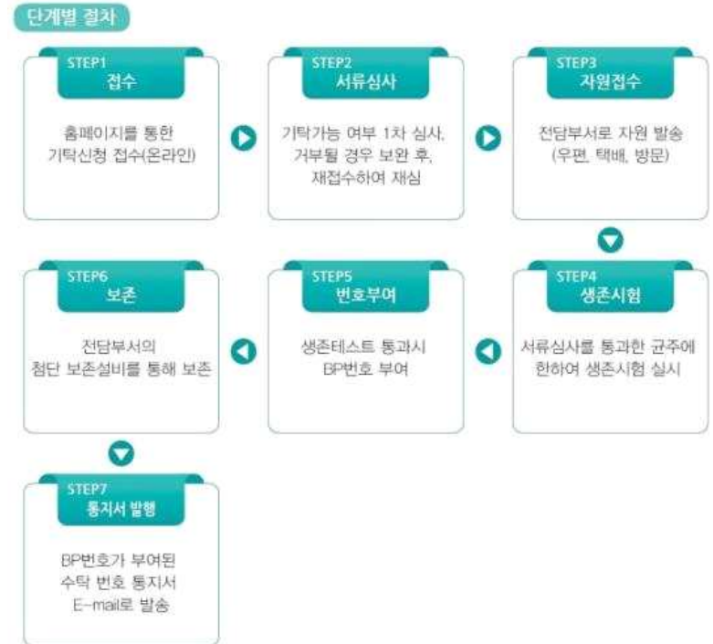
<기탁 단계별 절차>