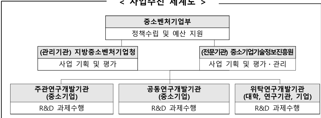
< 사업추진 체계도 >