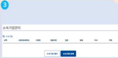
3 소속기업 등록 클릭