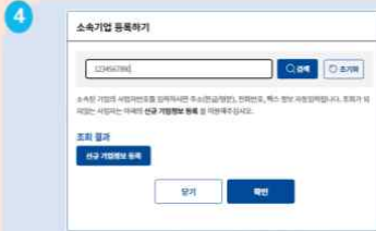
4 사업자등록번호 입력 후 검색, 신규기업정보 등록 클릭