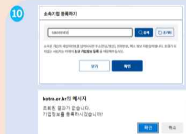
10 사업자등록번호 입력 후 검색 조회된 결과 없을 시 1600-7119 문의