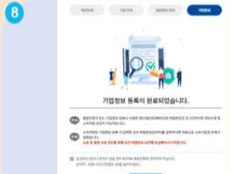
8 가입 완료 후 대기(KOTRA 확인 및 승인 필요) 5~10분 소요 예정(평일 업무시간 기준)