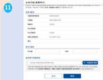
11 정상 조회 시 승인용 비밀번호(사업자번호 앞 6자리) 입력 비밀번호 확인 -> 확인 클릭