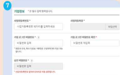
7 기업정보 입력(사업자등록증 첨부 필수), 기업로그인 비밀번호 설정 후 다음 단계 진행