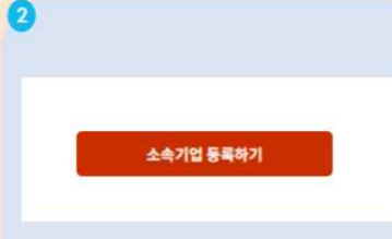
2 소속기업 등록하기 클릭