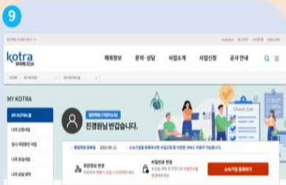
9 대기 후, 개인 일반회원 재접속, 소속기업 등록하기 클릭