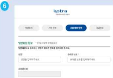
6 일반회원 가입시 입력된 성명/번호 입력 후 엔터, 아이디 정상 조회 여부 확인