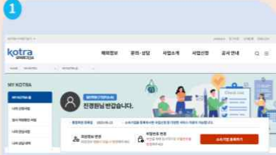
1 일반회원 로그인 후 myKotra(우측상단) 접속