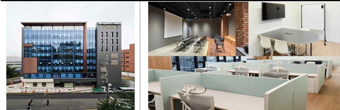
공유오피스, MERRY HERE 전경