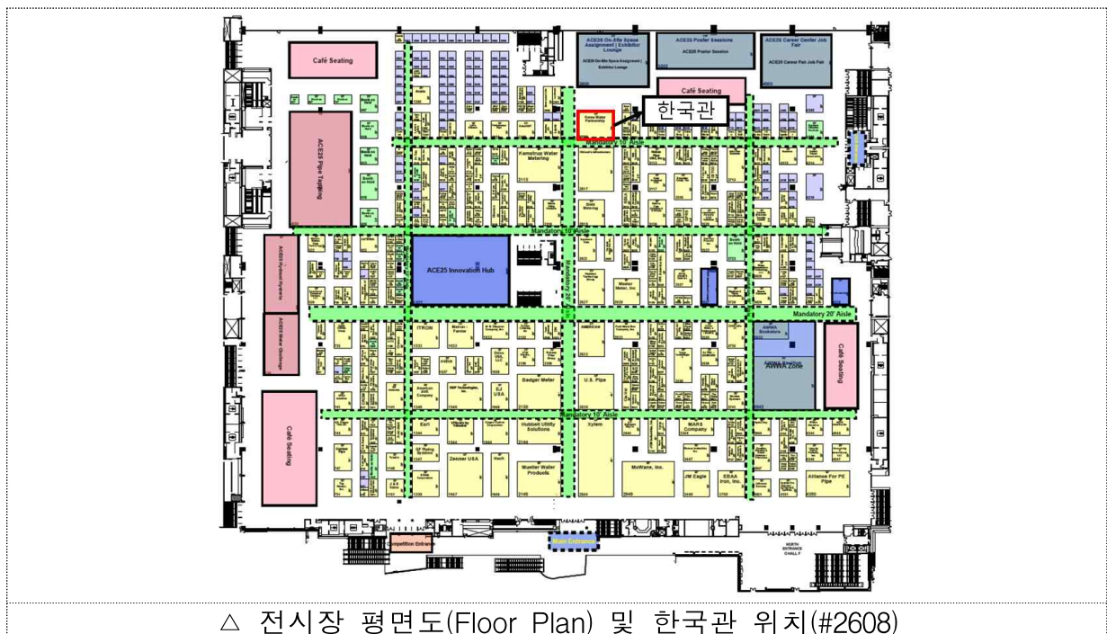
△ 전시장 평면도(Floor Plan) 및 한국관 위치(#2608)