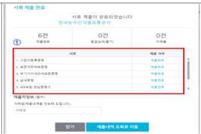
⑥ 원패스 제출 완료