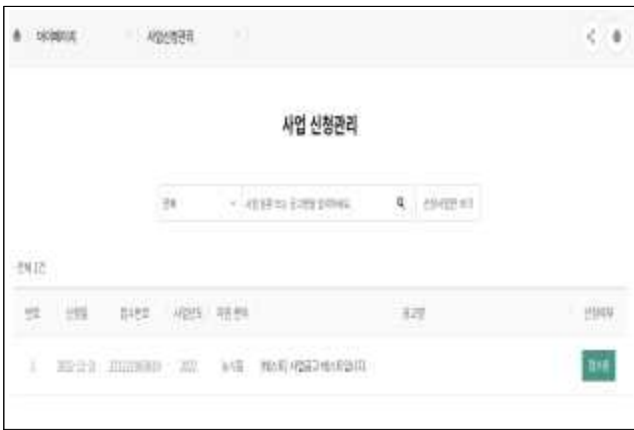
⑦ 사업 신청내역 확인 (마이페이지-사업 신청관리)