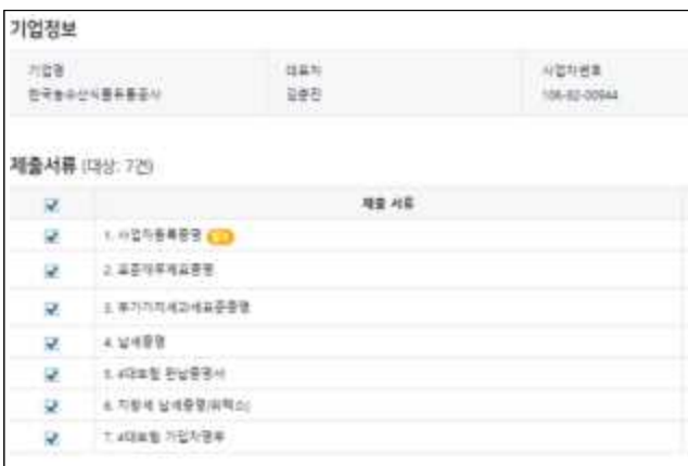
⑤ 자동 발급/제출 목록 확인 및 신청