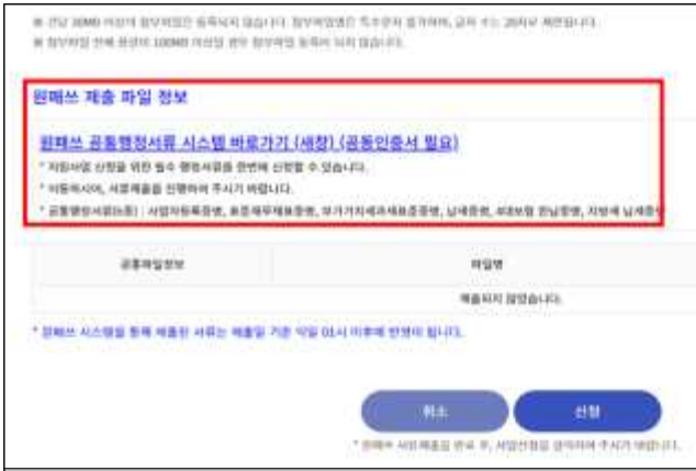
③ 사업신청서 하단의 원패스 바로가기 이동