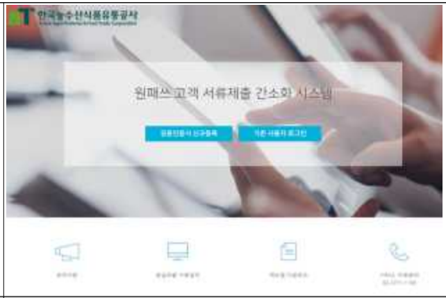
④ 원패스 시스템 공동인증서 신규 로그인