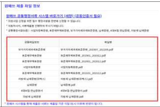
⑧ 지원사업내 제출서류 파일 확인 (완료)