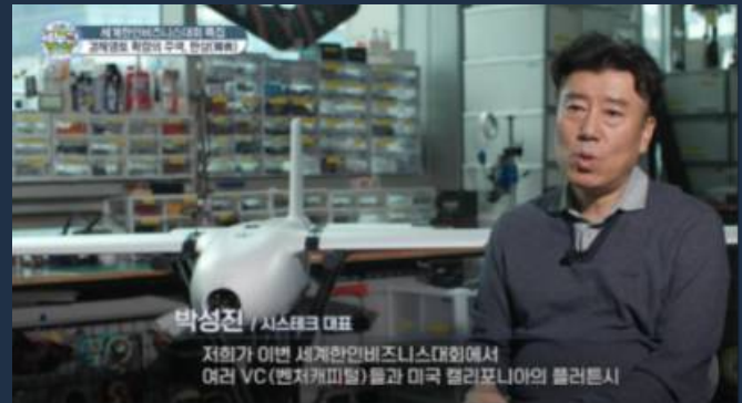
▲ 성공사례 3