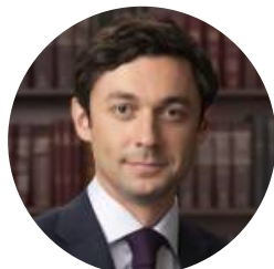
존 오소프 연방상원의원