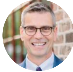
그렉 위트록 둘루스 시장