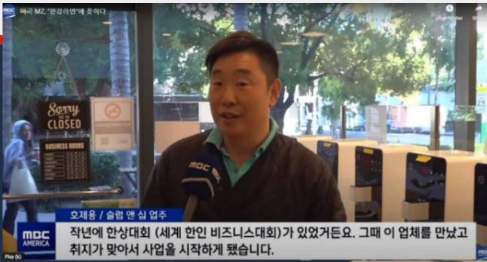
◀ 성공사례 1