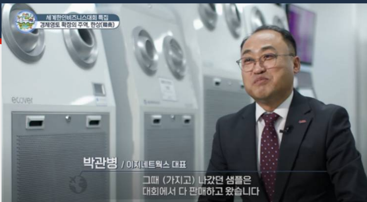
◀ 성공사례 4