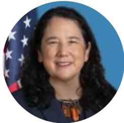
이사벨라 구즈맨 SBA 중소기업처장