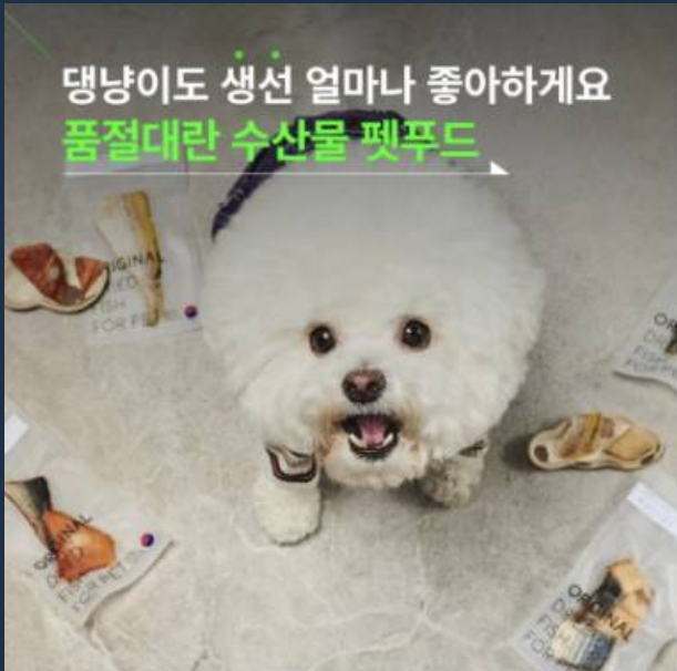
▲ 성공사례 6