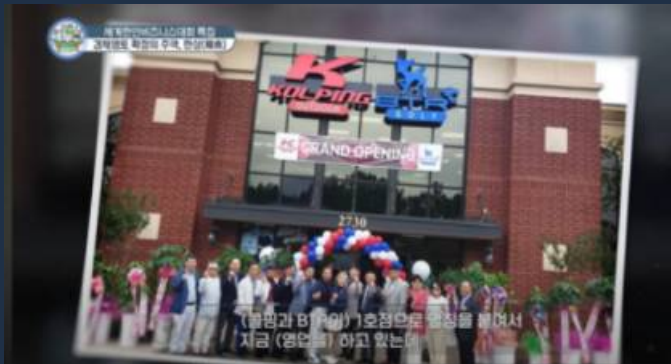
▲ 성공사례 2