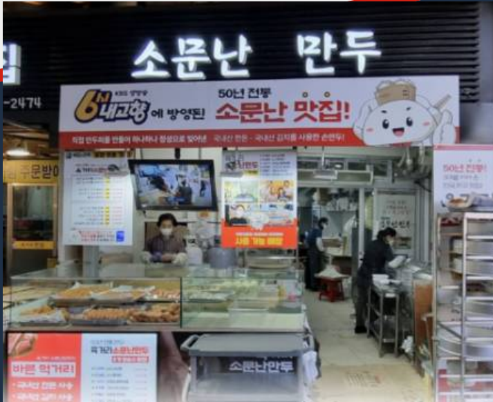
◀ 성공사례 5