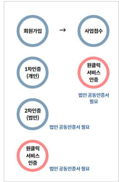
<DIPS 사업접수 순서>