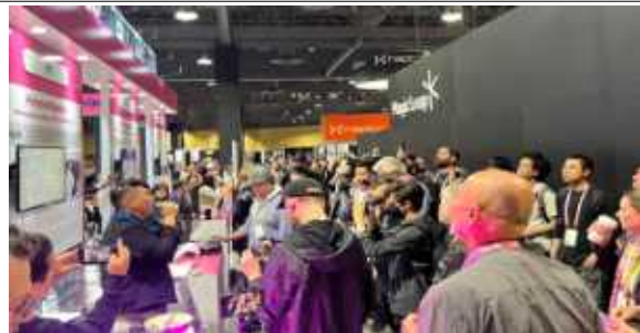
AWE USA 전시 현장(보도 등 사진 발췌)