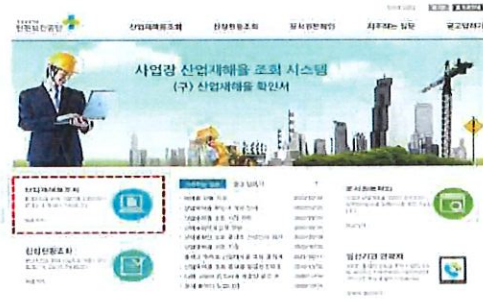
사업장 산업재해율 조회 시스템 ( https://certi.kosha.or.kr )