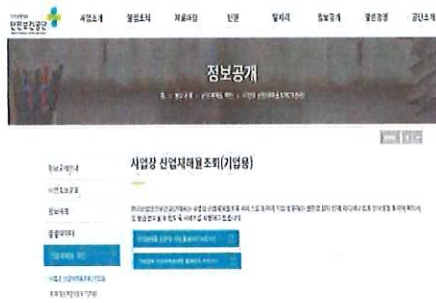
안전보건공단 홈페이지 ( https://www.kosha.or.kr )