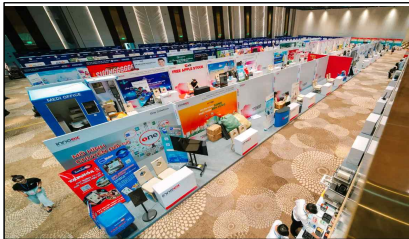
▲ 2024 InnoEX 전시사진