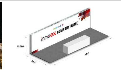
▲ InnoEX 공동부스 이미지(안)