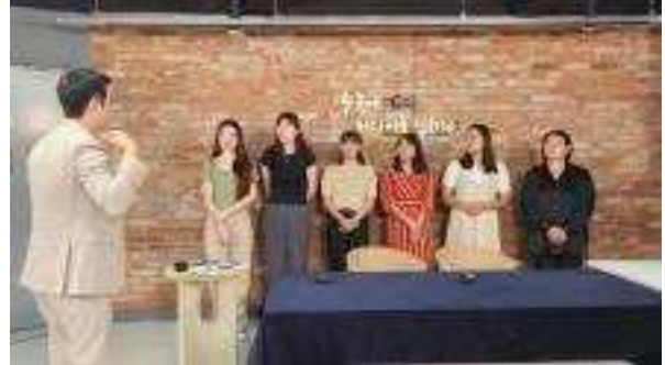
라이브커머스 쇼호스트 교육