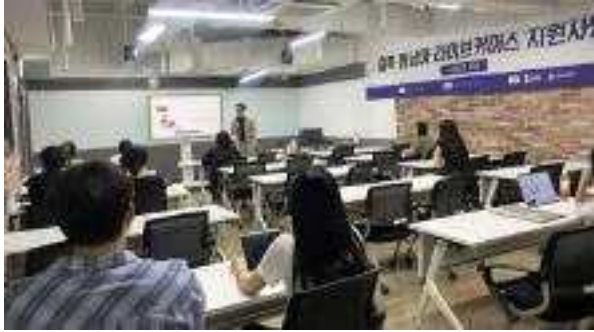
라이브커머스 쇼호스트 교육