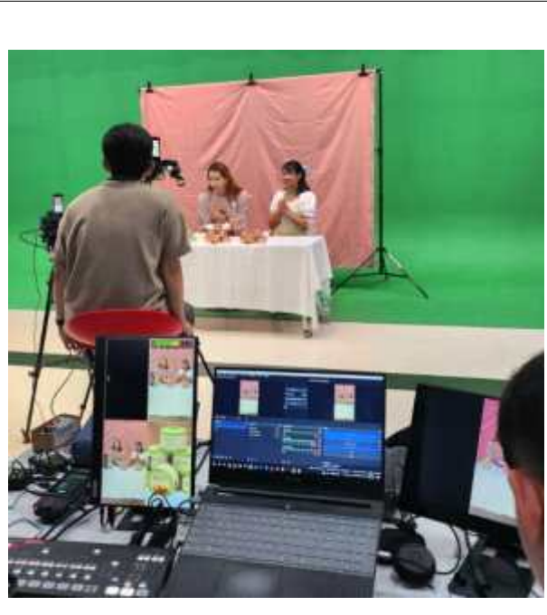
라이브커머스 방송 송출