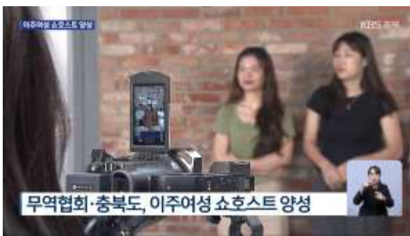
라이브커머스 언론 보도