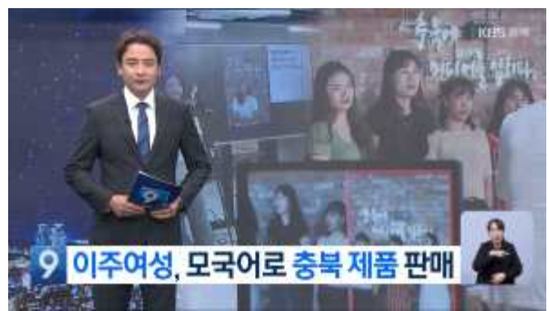
라이브커머스 언론 보도