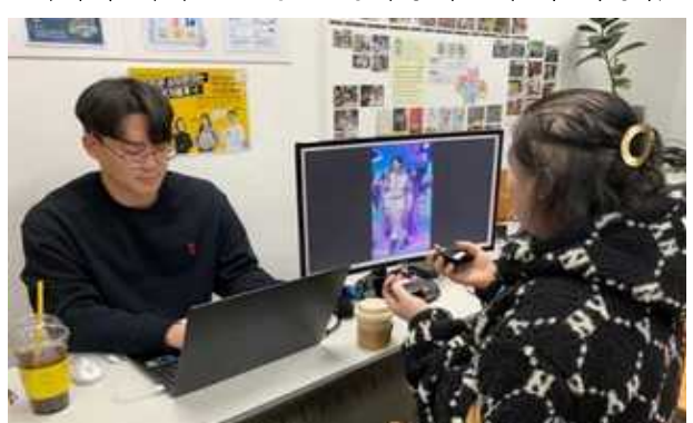
미디어 기기를 활용한 청각장애인 음악 리빙랩