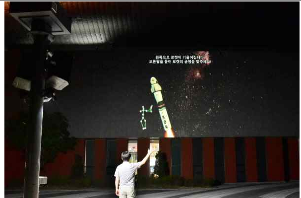
미디어 기반의 리빙랩 프로젝트 (밀양 아리랑 우주천문대 반응형 미디어아트)