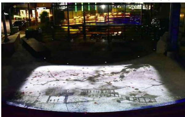
밀양 해천야외공연장 영남루 사계 미디어아트