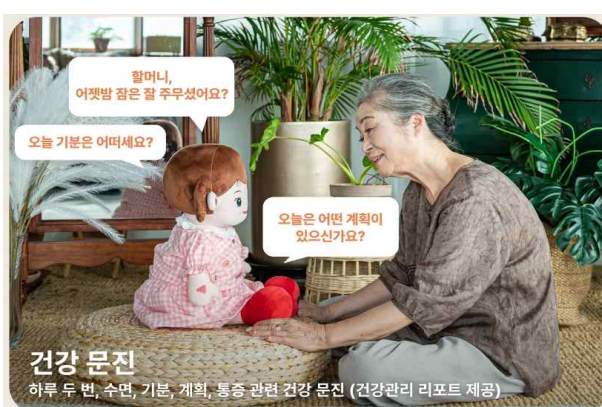
AI 돌봄로봇 ‘효돌’