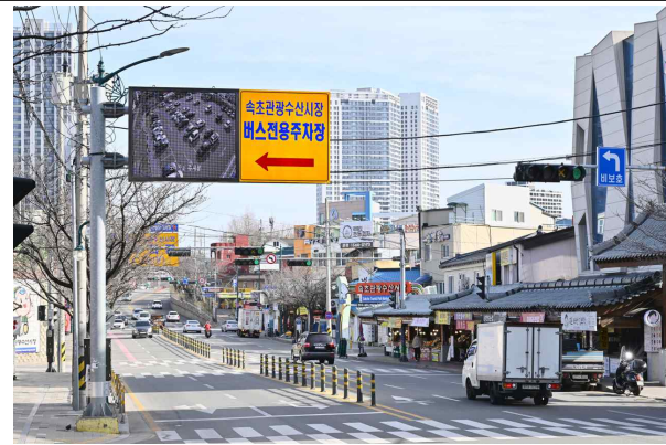
AI 기반의 리빙랩 프로젝트 (속초 관광지 실시간 주차공유 시스템)