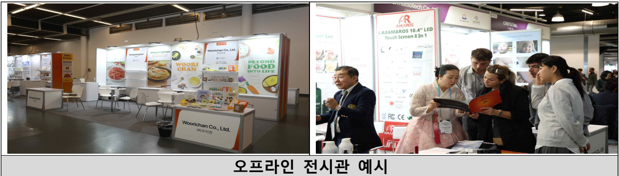
오프라인 전시관 예시