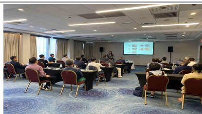
현지 구매설명회 추진 예시