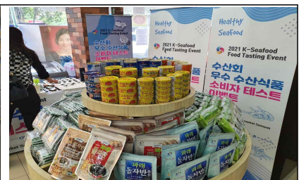
현지 유통매장 연계 판촉 행사 예시