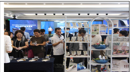
현장 시식회 예시