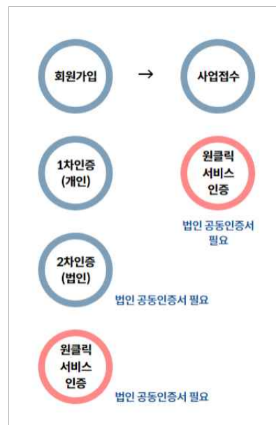
<DIPS 사업접수 순서>