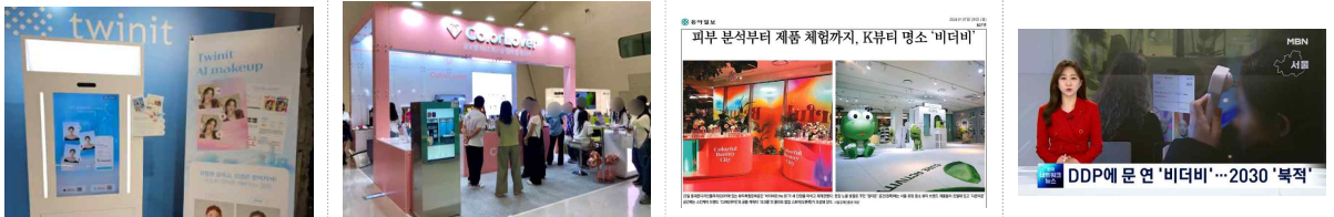
대내외 사업 연계를 통한 지원