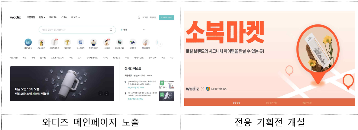
와디즈 메인페이지 노출