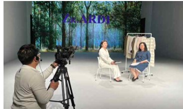
브랜드소개 및 인터뷰 (10')