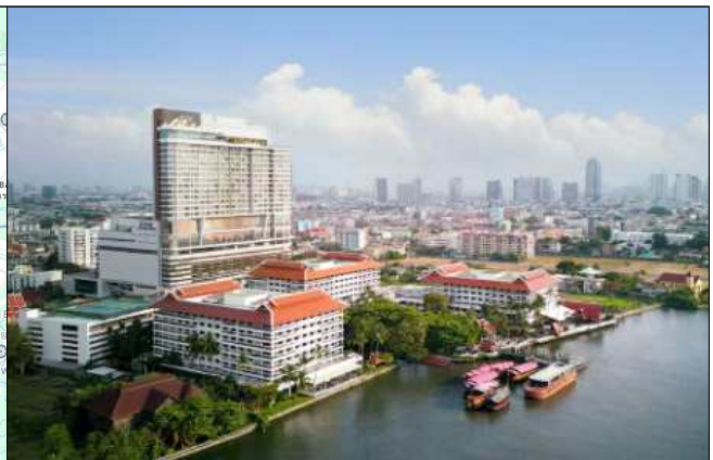
공항(수완나폼)-행사장(호텔) 차량으로 편도 1시간 거리(42km) * 권장 항공편 이용 시 차량 이동 지원(추후 공지)