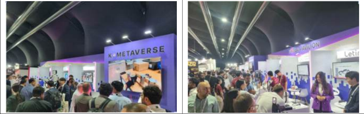
GITEX Global 전시 현장 (K-METAVEVERSE 2024, 보도, 인터넷 등 사진 발취)