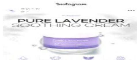
인스타그램용 홍보물 제작