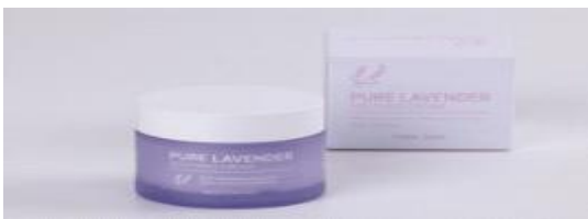
부산 K-스튜디오 촬영된 샘플 예시