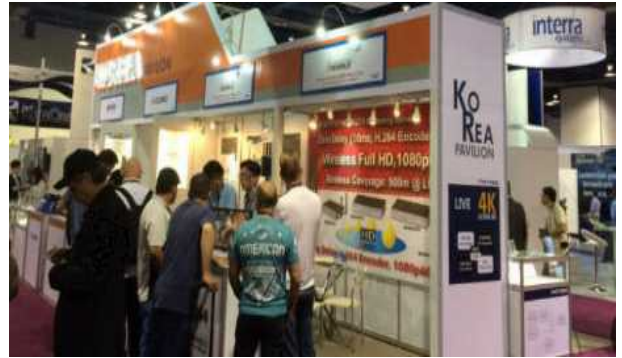
수출 희망기업 부산기업 상담지원