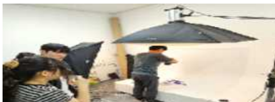
제품 샘플 사진 촬영