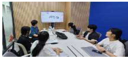
디지털 마케팅 전략 회의