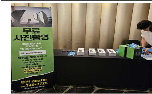
벅스코 전시회 이동식 스튜디오 운영