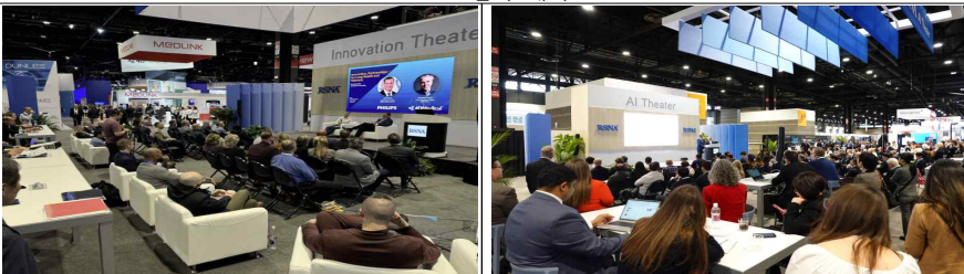
Innovation Theater Presentation