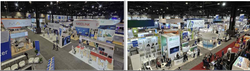
RSNA 전시 예시