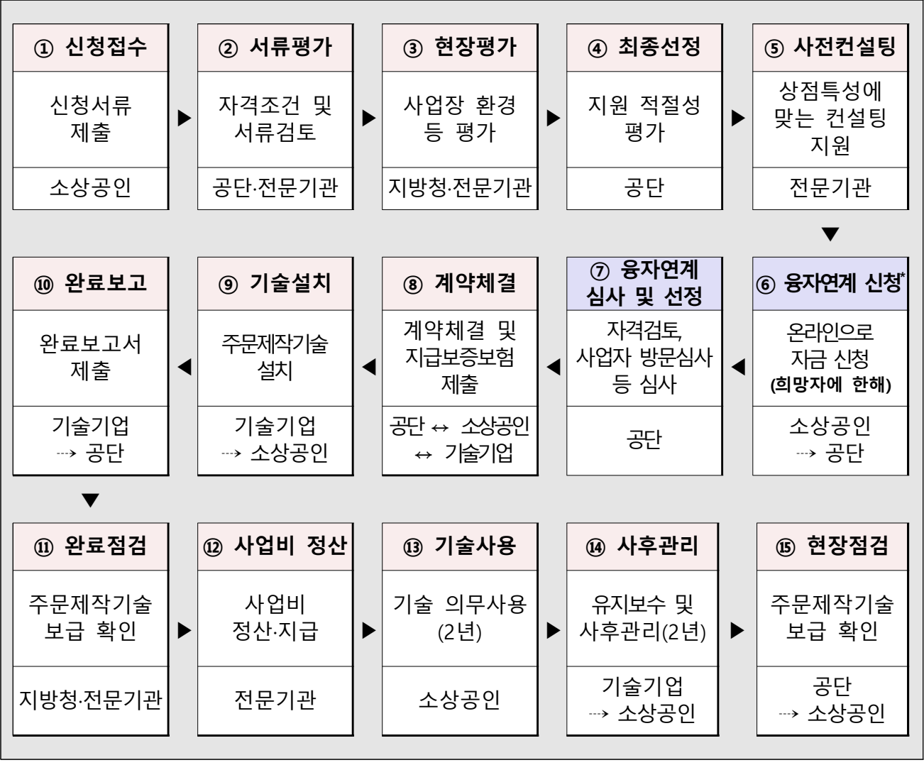
< 주문제작기술형 지원사업 추진절차도 >