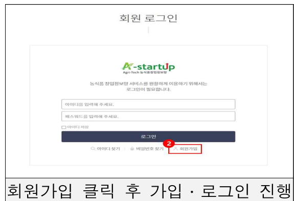
회원가입 클릭 후 가입·로그인 진행