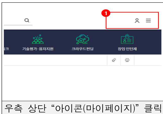
우측 상단 “아이콘(마이페이지)” 클릭