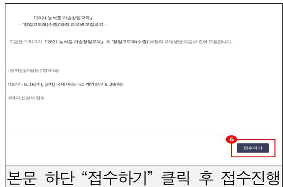
본문 하단 “접수하기” 클릭 후 접수진행