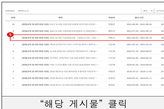
“해당 게시물” 클릭