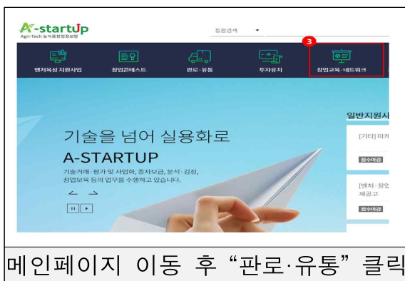
메인페이지 이동 후 “판로·유통” 클릭