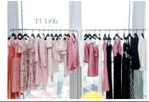
24년 10월 전시회 전경