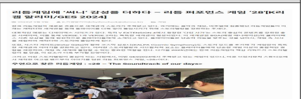
엔터위크(2024. 9. 9.)