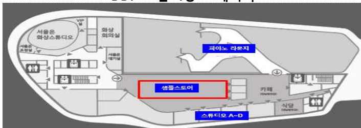
DDP 쇼룸 2층 샘플스토어