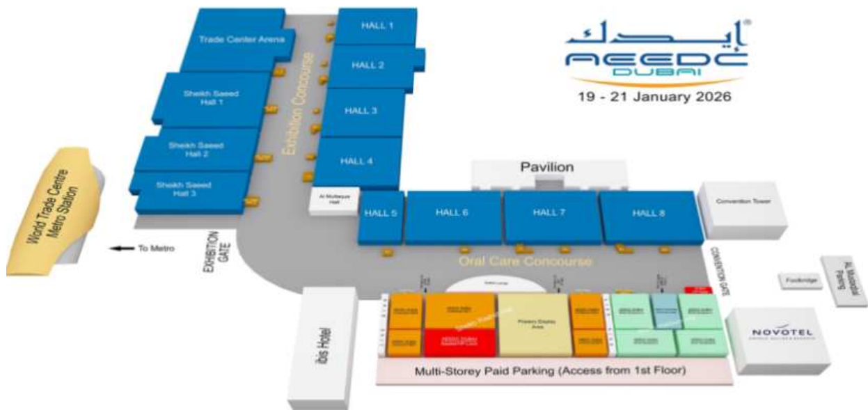
[그림]AEEDC Dubai 2026 도면