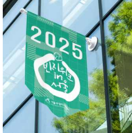
윈도우 플래그 B