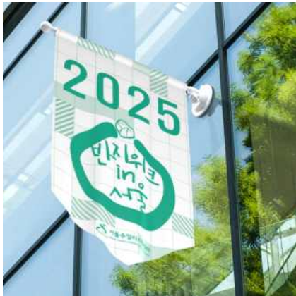
윈도우 플래그 A