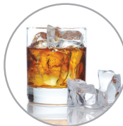
주류 및 음료