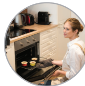
식품포장 및 주방기기