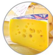
가공 및 유제품