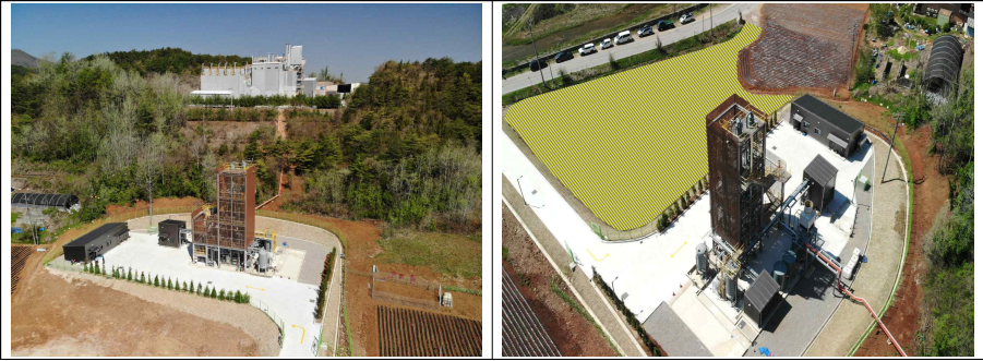
<탄소중립 융복합 자원화단지 및 CO 2 포집, 액화 설비>