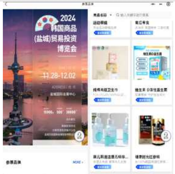
온라인(위챗 미니앱) 제품 홍보 사진