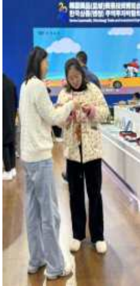
바이어 발굴(좌) 및 현장상담(우) 사진