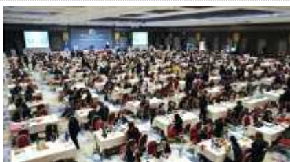
B2B 비즈니스 매칭 행사 전경