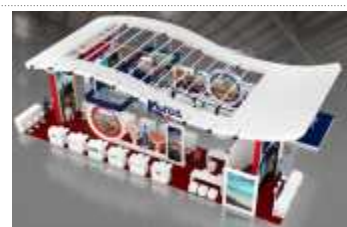
< 홍보관 천장 디자인(안) >