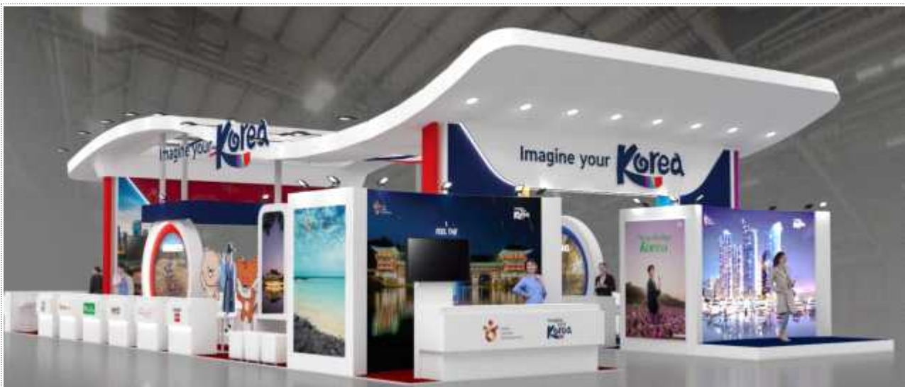
< 홍보관 디자인(안) >