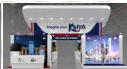
< 홍보관 내부 디자인(안) >