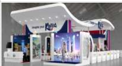
< 홍보관 전면 디자인(안) >