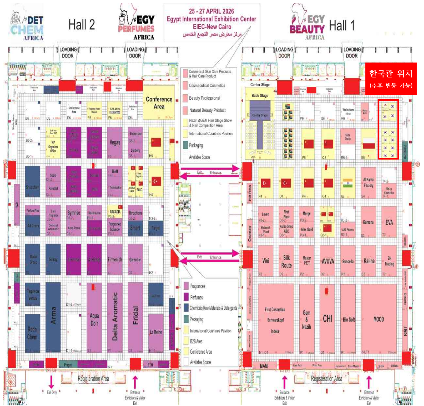
<Hall 1 도면 : 한국관 위치 표시 포함>