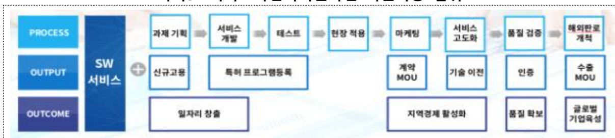
<지역SW서비스사업화지원사업 지원가능 범위>