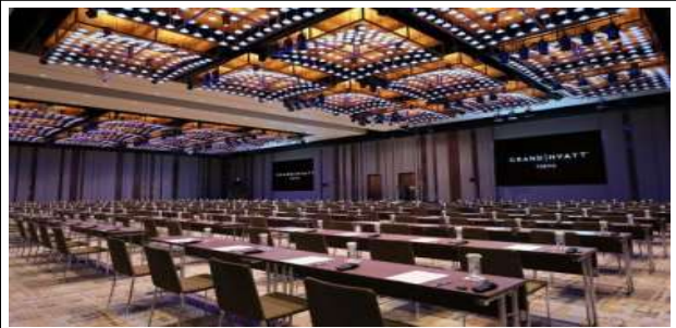
그랜드볼룸(한일관광교류의 밤 및 만찬장)