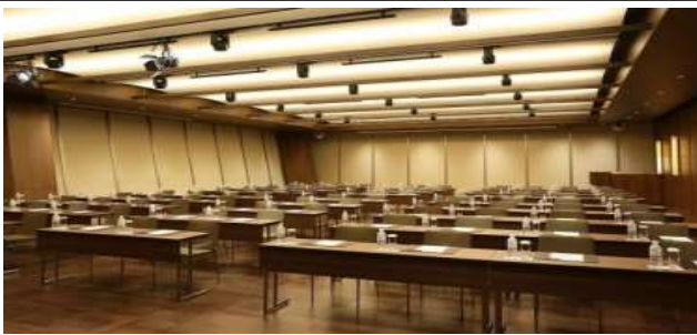
타라곤 룸(한국관광 설명회 및 상담회)