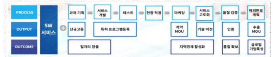
<지역SW서비스사업화지원사업 지원가능 범위>