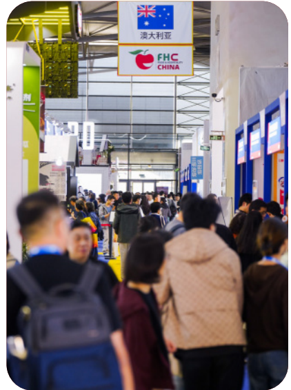
*세부 내용은 추후 변경될 수 있습니다.