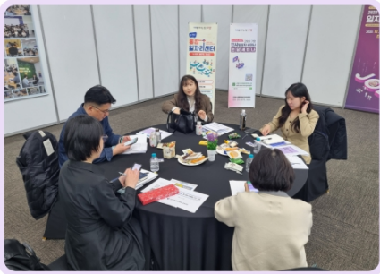
그룹별 교류 참여기업 간 정보교류