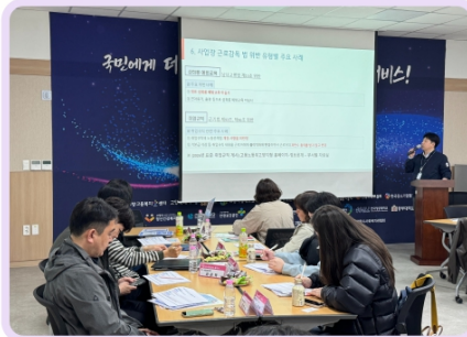
산업안전특강 고용노동부 고양지청