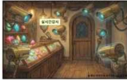
MDR의 감시: 실시간 행동 분석