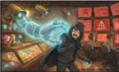
MDR의 대응: 즉각적인 개입