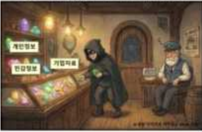
AV의 한계: 알려진 위험만 탐지