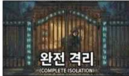
MDR의 격리: 피해 확산 방지