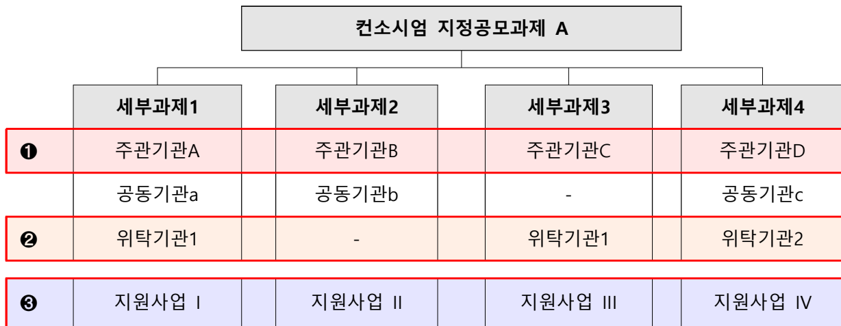
< 예시 : 컨소시엄형 기술개발 연구개발기관 구성(안) >