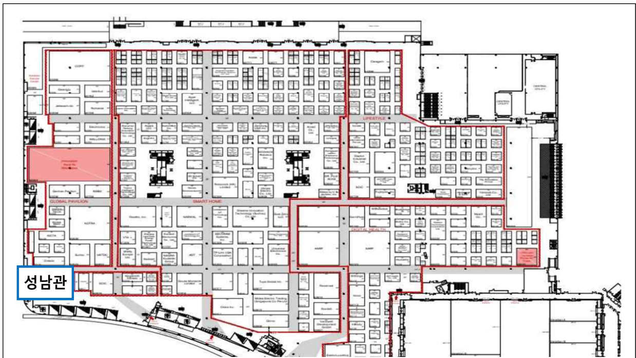
[CES 2026 성남관 위치 / Venetian Expo 2층]