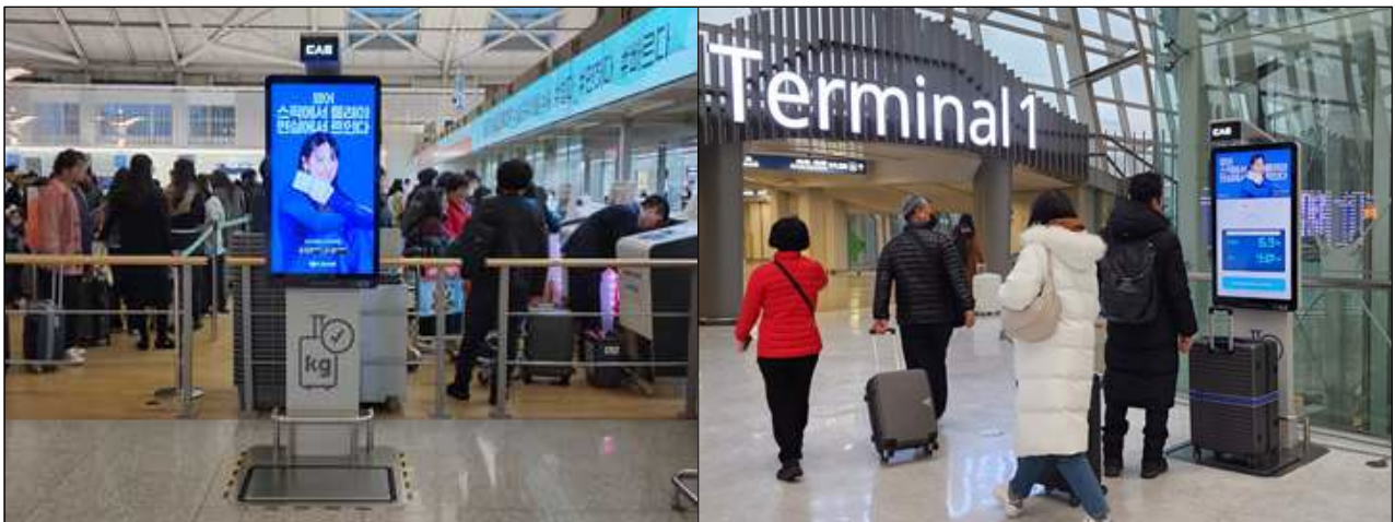
인천공항 키로뷰 광고